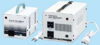
AU-500A / 1000AP / 1500AP