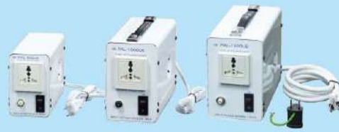
PAL-500UE(UK) / 1000UE(UK) / 1500UE(UK)