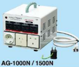
AG-1000N / 1500N