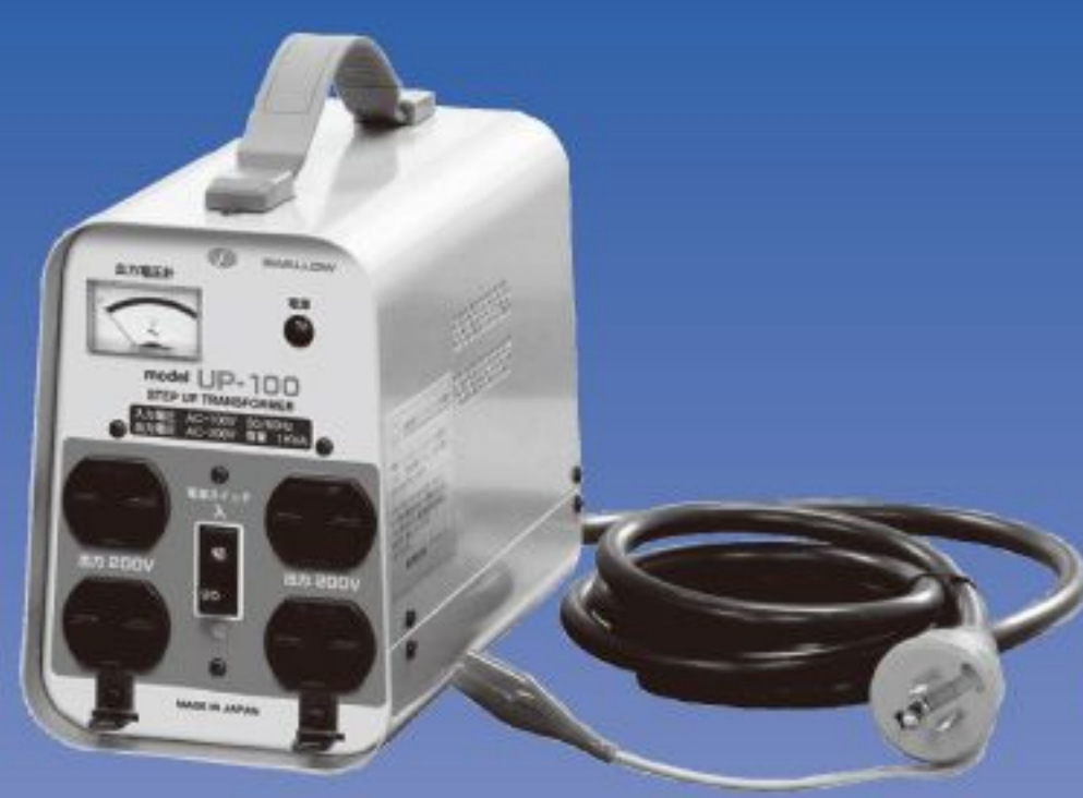
UP-100 / 300