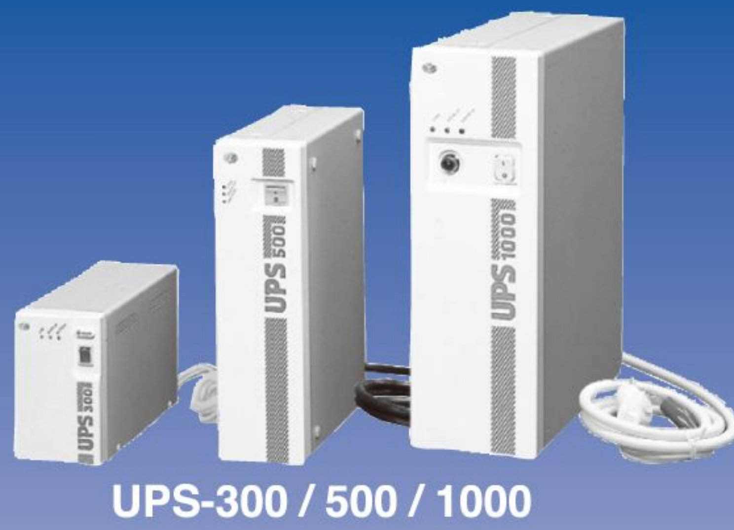
UPS-300 / 500 / 1000