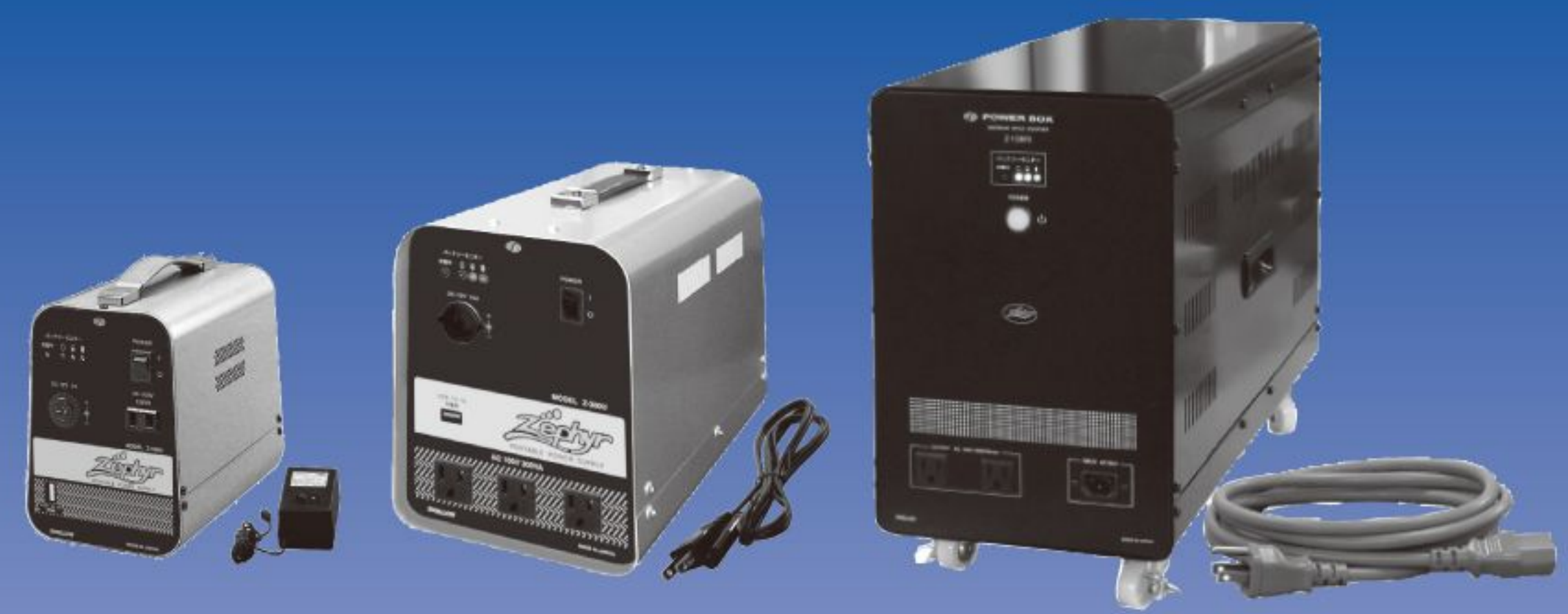
Z-130U / 300U / 600U / 1200S