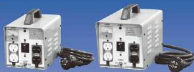
TBN-200 / 300