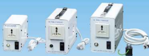
PAL-500UE(UK) / 1000UE(UK) / 1500UE(UK)