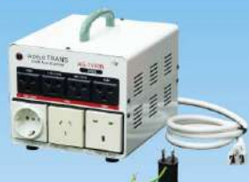
AG-1000N / 1500N