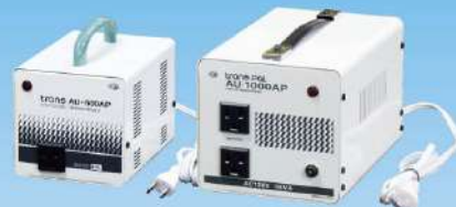
AU-500A / 1000AP / 1500AP