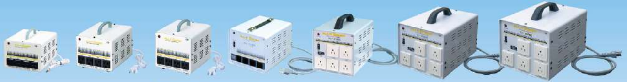
SU-550G / 1000G / 1500G / 1700G / 2000G / 2500G / 3000G