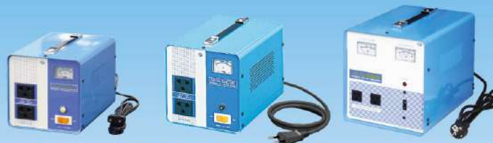
AVR-1000E / 1500E / 2000E